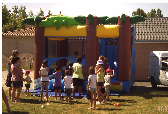
LE PIM CAFE